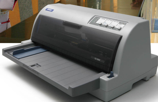
平台式24針點陣印表機 LQ-690C