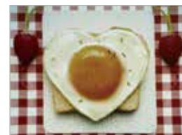
* 投影畫面為示意圖