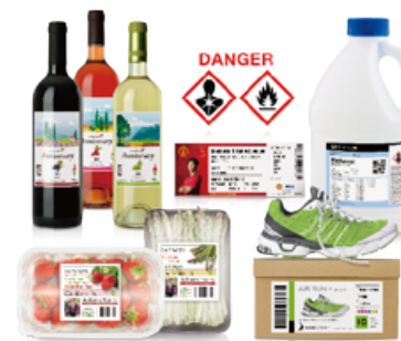
可廣辦應用於各項標籤列印